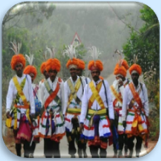
Kundapura kudubi tribal community wearing the feathers of Flying Catch (Hattimudda)

Interestingly, the Hattimudda bird holds a special place in the culture of the Kundapura Kudubi tribal community. During their traditional Holi Hunnime dance, they adorn themselves with the bird's feathers in their turban. Between February and April, Hattimudda birds build small, cup-shaped nests using husk and cobwebs, laying eggs to reproduce. I've always been fascinated by these birds, and I hope this introduction will inspire you to appreciate and enjoy watching the "Hattimudda" birds, a true marvel of nature.