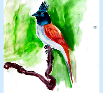
Art by, Aarav Yashawant, 8th E